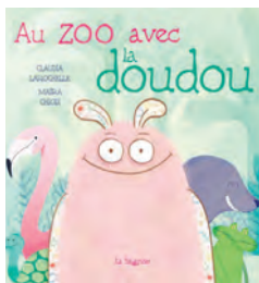
AU ZOO AVEC LA DOUDOU C. Laroche, M. Chiodi ill.