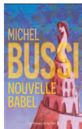
NOUVELLE BABEL Michel Bussi