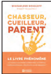
CHASSEUR, CUEILLEUR, PARENT Michaelle Doucleff