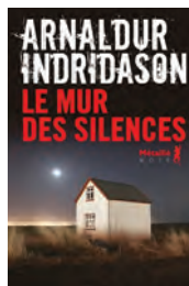
LE MUR DES SILENCES Arnaldur Indridason